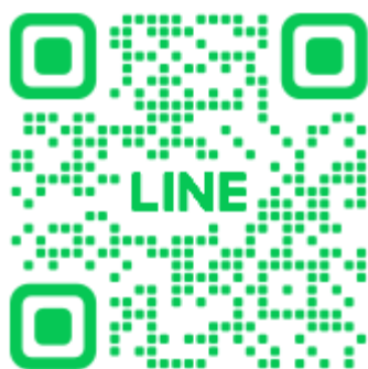
自由ヶ丘コミセン公式LINE