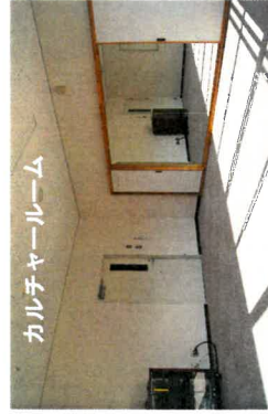
カルチャールーム