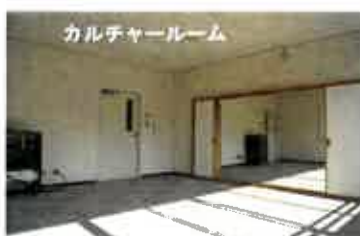
カルチャールーム